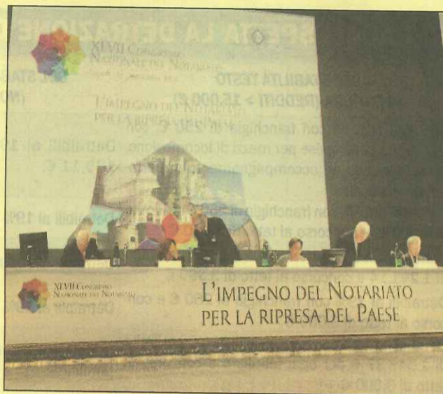
Il palco del Congresso

La risposta del ministro. In difesa del ruolo svolto dalla categoria, il guardasigilli ha detto: «Se le parti affidano la regolamentazione dei loro