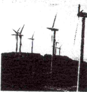
PALE E RISARCIMENTI Cresce il contenzioso sull'eolico

● BARI. Un vero e proprio bubbone che rischia di far sprofondare la Regione in un pauroso contenzioso. Parliamo delle liti in materia di «rinnovabili» che vedono la Puglia cinta d'assedio da investitori italiani e stranieri, rappresentando al tempo stesso un boccone appetitoso per la cosiddetta ecomafia. Un problema che non si ricava solo dai dati dei ricorsi al Tar (in un anno sono più che raddoppiati quelli in materia energetica) ma anche dalla massa di pratiche in attesa di esame da parte dei competenti uffici regionali. Dal 2010 al 2011, dunque, l'asticella del contenzioso ha registrato il raddoppio delle liti energetiche raggiungendo quota 250, metà delle quali costituite dal cosiddetto «silenzio». Un aspetto, quest'ultimo, che non è un buon indicatore di performance